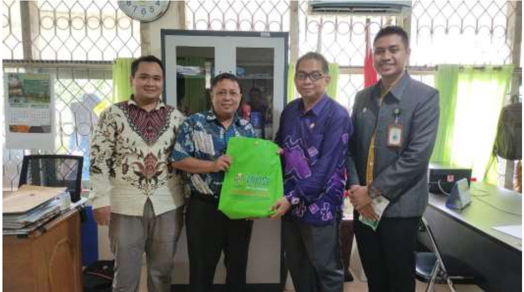
Dosen Pendidikan Sains

Koordinator prodi, sekretaris jurusan dan ketua Jurusan