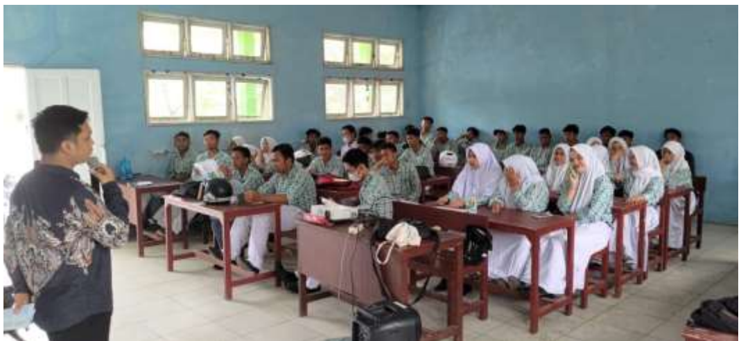
SISWA SMK Kelas XII

Sasaran Kegiatan sosialisasi adalah siswa tingkat SMA, SMK dan MA yang ada di Kalimantan Timur