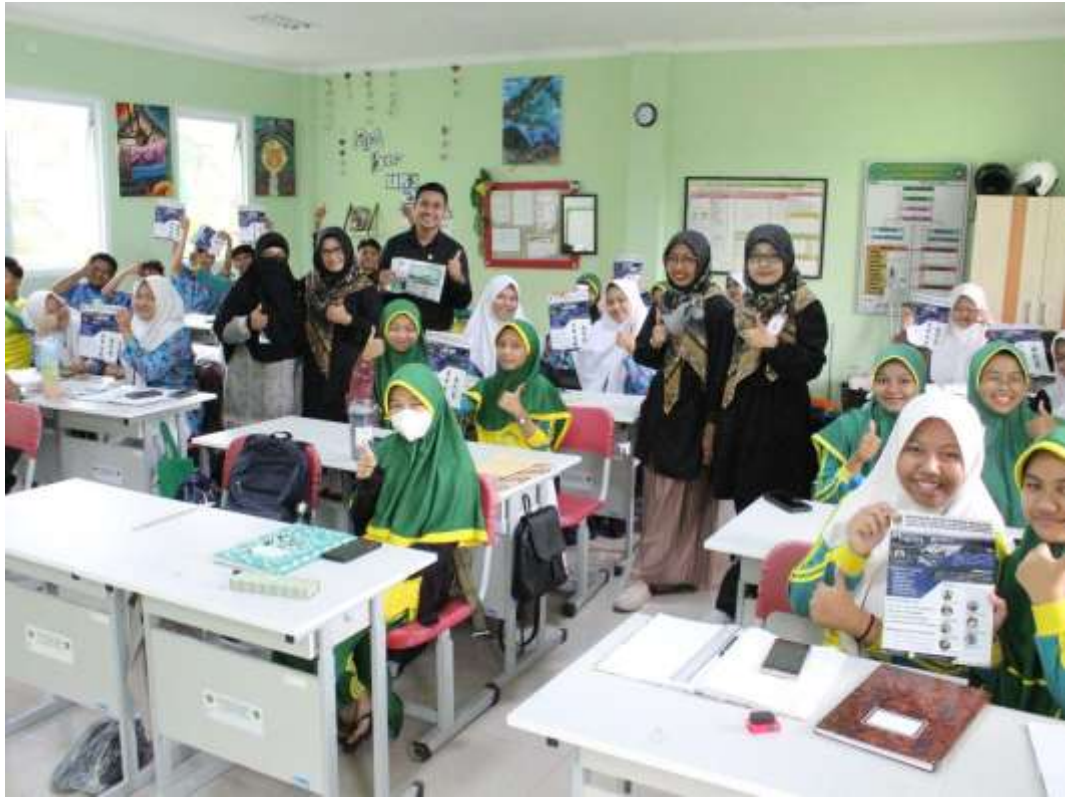
SISWA SMA Kelas XII