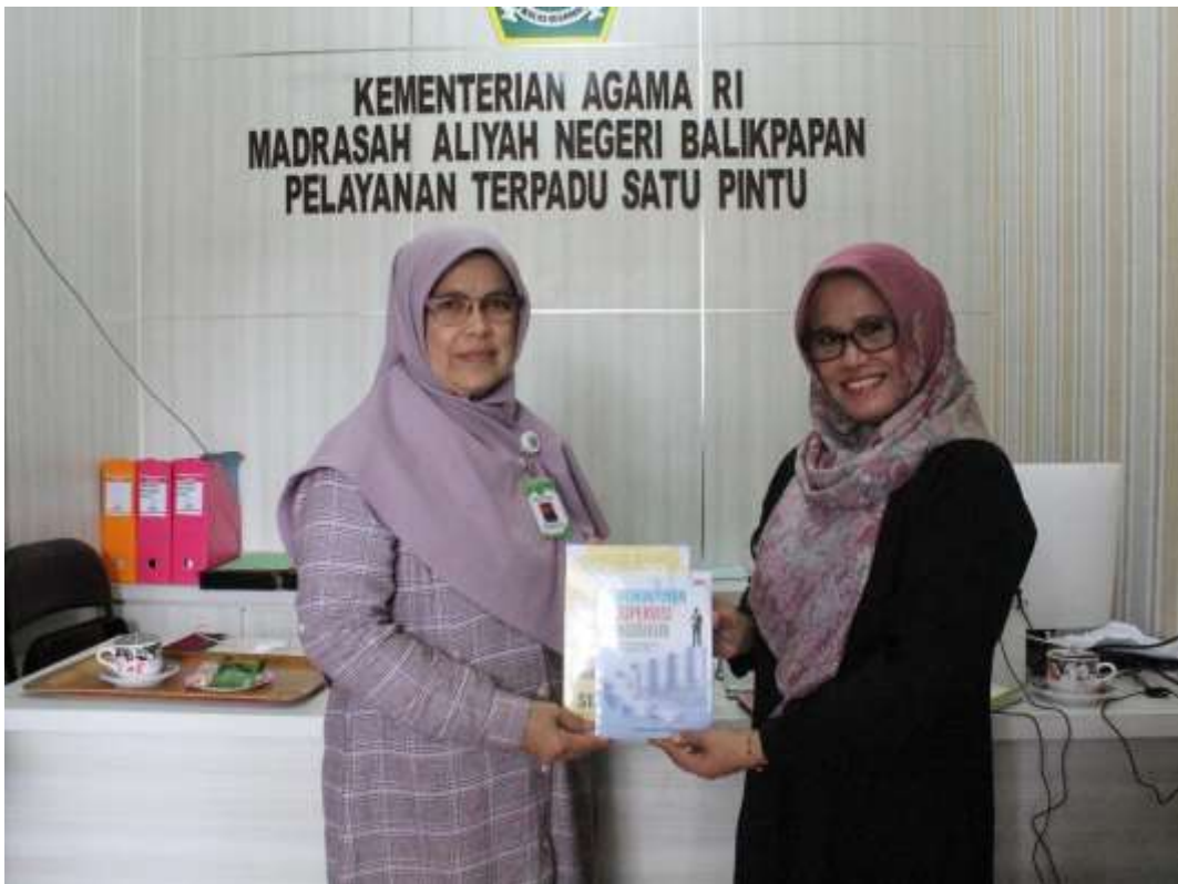
6. SMK Labaika Samarinda